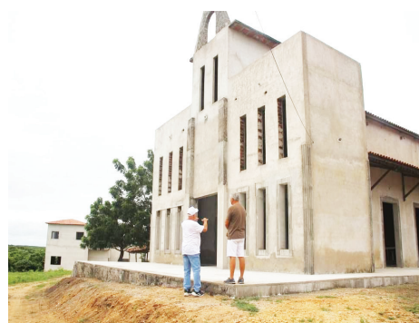
Igreja de Santo Expedito.