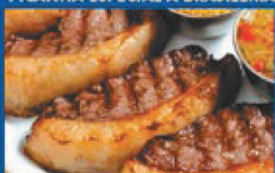
Top Sirloin Caprice, beans, french fries and 'farofa' PARA 1 SERVEM 2 PESSOAS