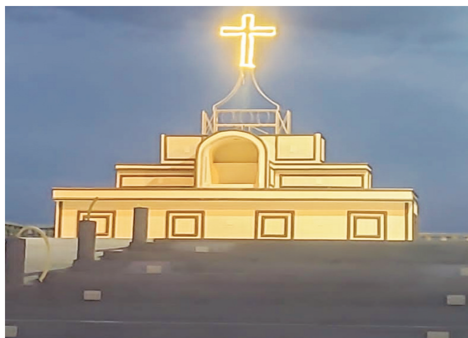
Altar da Igreja Sagrado Coração de Jesus

ENTRA ANO E SAI ANO, REPI-TO, ME SINTO AMÁVEL, POR TODA A MINHA VIDA. FELIZ ANO NOVO !