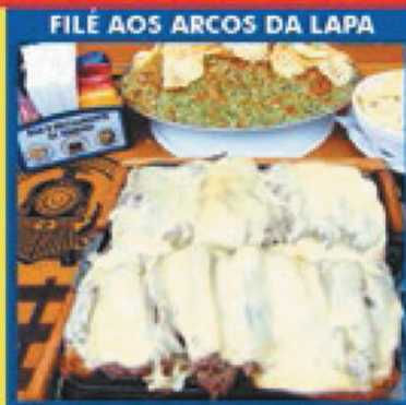
FILÉ AOS ARCOS DA LAPA

Aceitamos Cartões de Débito, Crédito, Refeição e PIX!