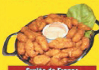
Gurjão de Frango