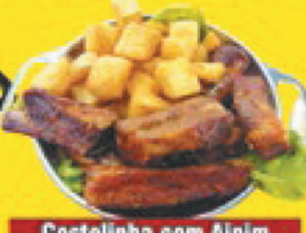
Costelinha com Alpin