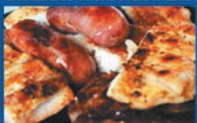
Mix Barbecue, beef, chicken and pork, seasoned with salt and grilled brazilian style PARA 1 SERVEM 2 PESSOAS PARA 2 SERVEM 6 PESSOAS

Na PRAÇA JOÃO PESSOA, esquina da Mem de Sá com Gomes Freire, perto dos ARCOS DA LAPA