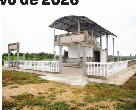
Casa de Oração ARCÊNIO

"As instalações do SANTUÁRIO CORAÇÃO DE JESUS - FINAL DOS TEMPOS, no tocante as JUNTADAS DOS VIVOS E DOS MORTOS, que já estão ocorrendo no mundo: pra ser mais exato, no BRASIL, no meu querido ESTADO DO CEARÁ, na minha querida cidade de GROAÍRAS, no bairro Cantagalo, fazenda Pirapora, atualmente: PIRAPORA SANTA. Lá está sendo