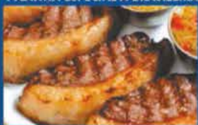
Top Sirloin Caprice, beans, french fries and 'farofa' PARA 1 SERVEM 2 PESSOAS