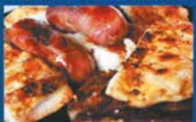
Mix Barbecue, beef, chicken and pork, seasoned with salt and grilled brazilian style PARA 1 SERVEM 2 PESSOAS PARA 2 SERVEM 4 PESSOAS

Na PRAÇA JOÃO PESSOA, esquina da Mem de Sá com Gomes Freire, perto dos ARCOS DA LAPA