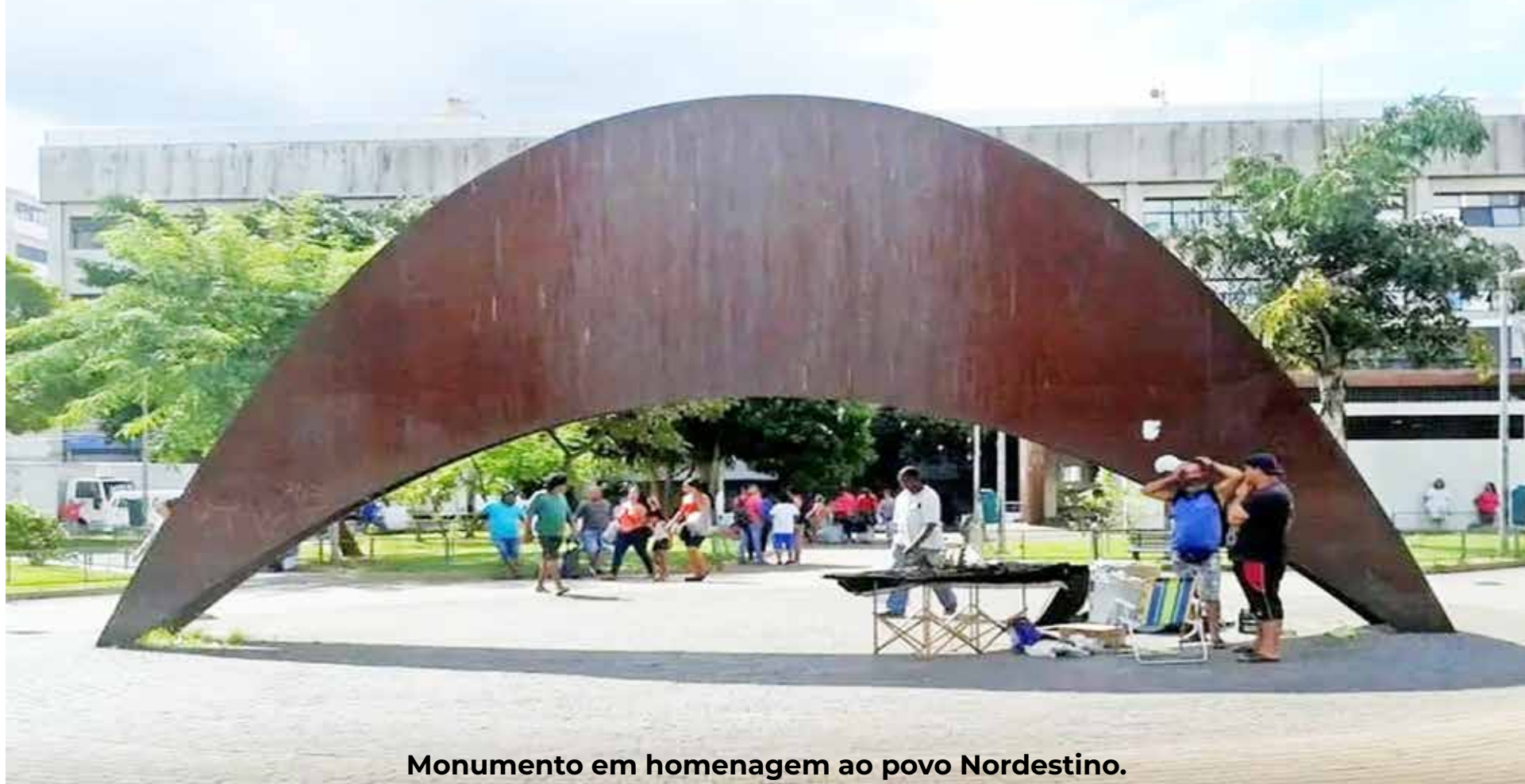
Monumento em homenagem ao povo Nordeste.

E m São Paulo existe um Monumento em homenagem aos migrantes do Nordeste no largo da Concórdia, bairro do Brás. Trata-se de um Chapéu de Couro Gigante, com mais de 10 metros de