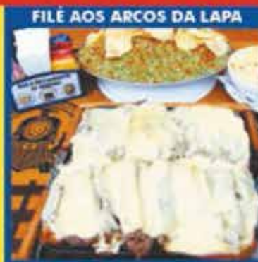
FILE AOS ARCOS DA LAPA

Aceitamos Cartões de Débito, Crédito, Refeição e PIX!