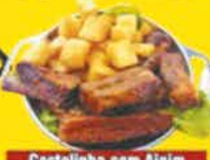
Costelinha com Aipim