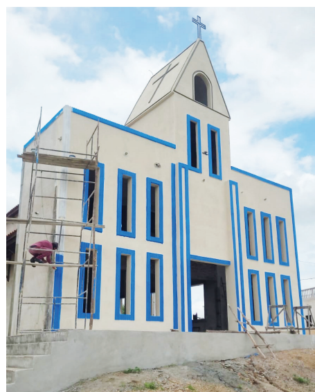
Fachada da Igreja de Santo Expedito, parte integrante do SANTUÁRIO.

cido ao apoio que tenho recebido de diversos órgãos de imprensa falada, escrita e televisada, que tiraram um pouco de seu precioso tempo, para prestigiar e divulgar em seus canais de comunicação, a GIGANTE OBRA, que estamos, com as GRAÇAS DE DEUS, edificando em minha terra natal, a Cidade de GROÁIRAS, no bairro Cantagalo, na fazenda Pirapora, Ceará: o maior SANTUÁRIO DE TODOS OS TEMPOS no Nordeste brasileiro. Neste aspecto quero citar alguns profissionais de imprensa, que estiveram comigo na ocasião em que