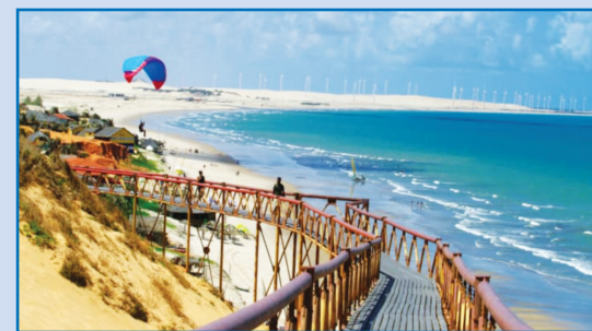
A Cidade de Aracati esconde um litoral cheio de belas praias.

As opções de lazer misturam a exploração da Natureza com mergulho na história Colonial do Ceará.