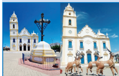
Centro histórico de Aracati, guarda muitas surpresas.

RUA GRANDE - via histórica de sobrados coloniais, museus e o famoso museu Jaguaribe.