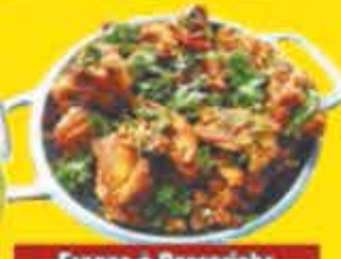
Frango à Passarinho