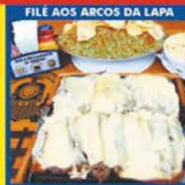
FILE MIGNON AOS ARCOS DA LAPA

Aceitamos Cartões de Débito, Crédito, Refeição e PIX!