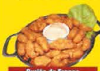
Gurjão de Frango