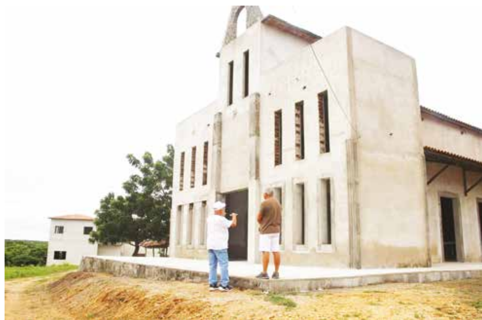
Igreja de Santo Expedito.

segmento e cumprindo o propósito de DEUS, PAI ETERNO, com o objetivo de "talhar" a morte que caiu sobre nós. Todos nós seres humanos temos por obrigação de comemorar tão dignificante data, bem como cumprir os mandamentos da lei divina, que é AMAR AO PRÓXIMO COMO A SI MESMO E FAZER O BEM SEM OLHAR A QUEM.